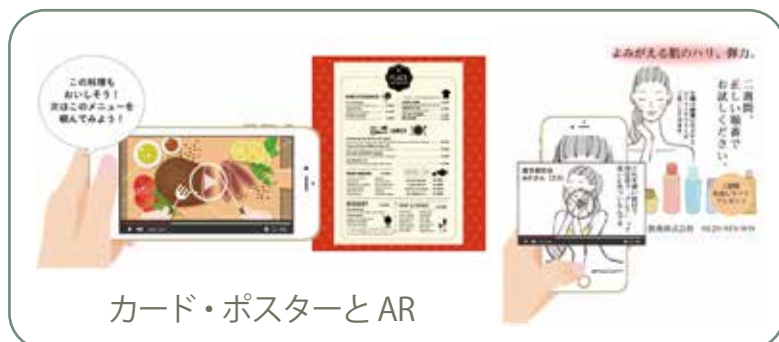
カード・ポスターとAR

いままでコストが高く、二の足を踏んでいた動画制作をリーズナブルにクリアすることで、COCOAR(ココアル)の導入がより身近になります。COCOAR(ココアル)の一番のポイントは、すでに出来上がっている印刷物、例えば名刺、パンフレット、チラシ、パッケージなどをARマーカーとして使用できること。また状況に合わせて何度でも、コストを掛けずに変更することが可能なこと。コンテンツについても、すでに作成したものがあればそのまま利用可。入れ替えも簡単にできます。ARマーカーを持つことで、企業や店舗の紹介はもとより、ジャストタイムな情報やインタビュー動画の発信も可能となり、よりお客様との距離を近くすることができます。COCOAR(ココアル)は、プッシュ通知の機能やアクセス解析の機能も充実。お客様へのフォローアップや販売計画の分析が、手元で簡単にできるようになります。