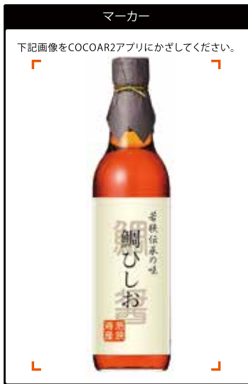
※この商品のレシピ動画がご覧いただけます