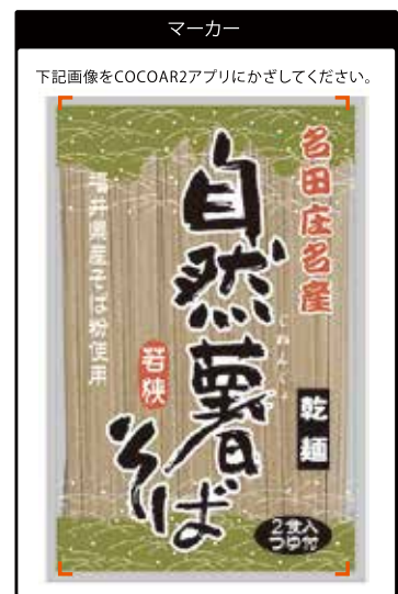
※この商品のレシピ動画がご覧いただけます