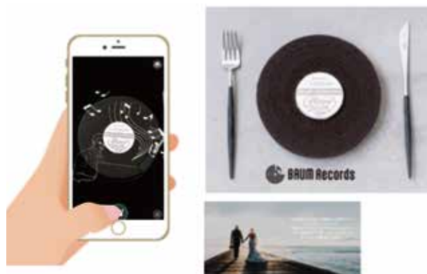
case 04 レコード型バウムクーヘン「バウムレコード」／スイーツギフト フランス菓子工房 ラ・ファミーユ様

まっ黒なレコード型バウムクーヘン「バウムレコード」セットにARが付属。プレゼントするシーンに合わせた音楽を選ぶことが出来、同封のステッカーにアプリをかざすとアニメーションと音楽を視聴できる。ウェディング業界から多くの問い合わせを増やすことができた。