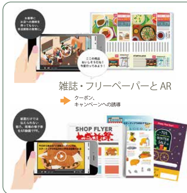
雑誌・フリーペーパーとAR